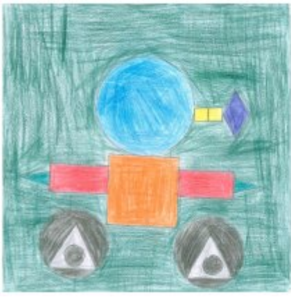
6°1 - Lorenzi Roman Neela - le tractoforme